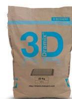
SACOS 10 / 20 kg