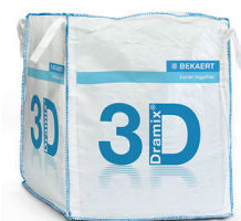
BIG BAG 800 - 1.100 kg